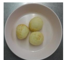
もちもちチーズパン